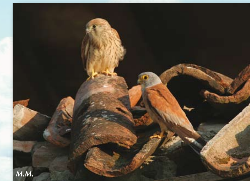
Coppia di grillai

Solitamente i grillai si riuniscono al tramonto in alcuni alberi, che divengono una sorta di grande dormitorio in cui difendersi più facilmente dai predatori.